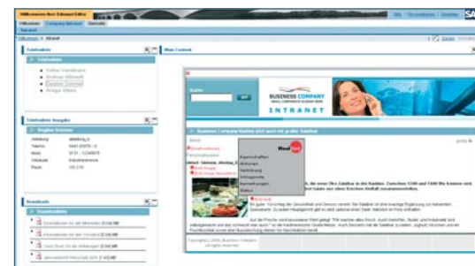
Ändern vom Web-Inhalten direkt in der Portal-Oberfläche.

RedDot Solutions AG Industriestraße 11 26121 Oldenburg T +49-441-93578-0 F +49-441-93578-88 E info@reddot.de W www.reddot.de